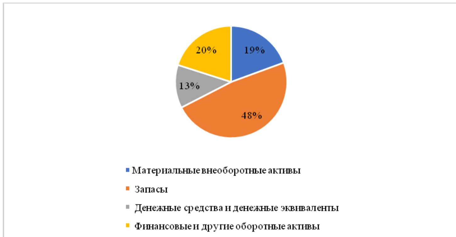
Рисунок 2.4 - Соотношение основных групп активов организации

На диаграмме ниже наглядно представлено соотношение основных групп активов организации: